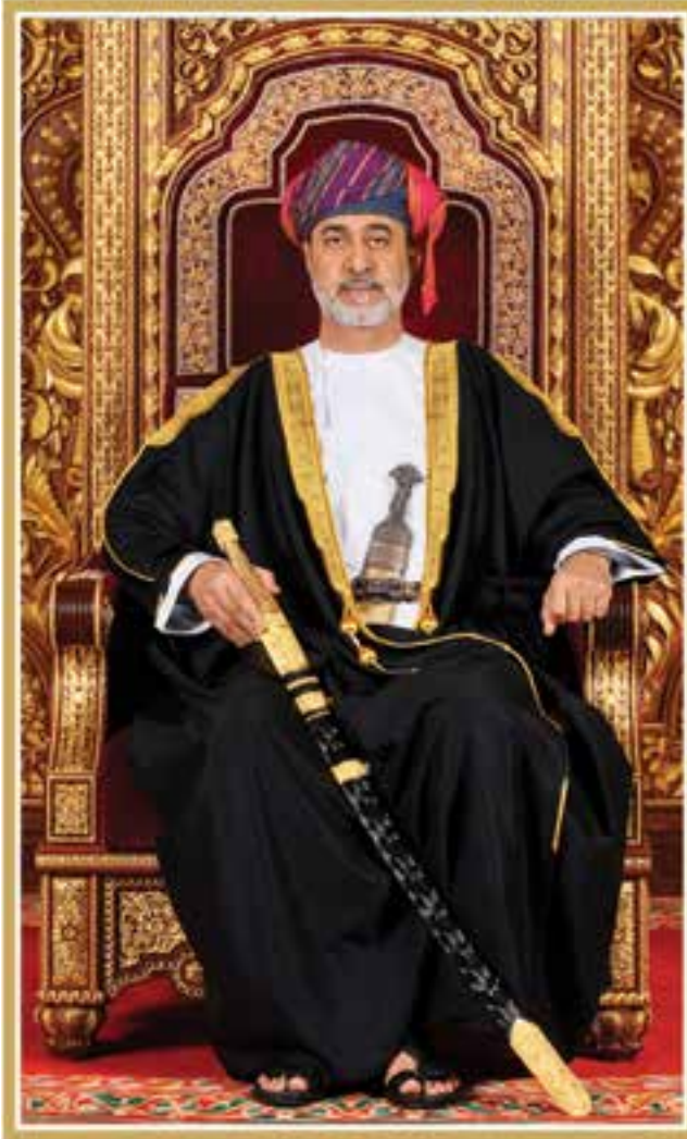
حضرة صاحب الجلالة السلطان هيثم بن طارق المعظم - حفظه الله ورعاه -