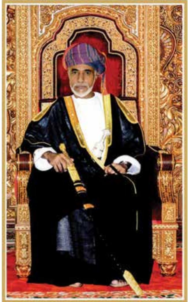
المغفور له السلطان قابوس بن سعيد - طيب الله ثراه -