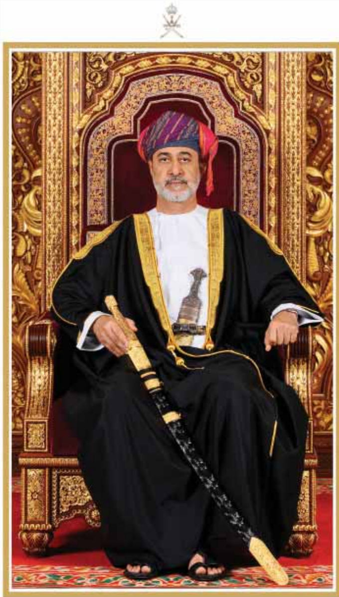
حضرة صاحب الجلالة السلطان هيثم بن طارق المعظم