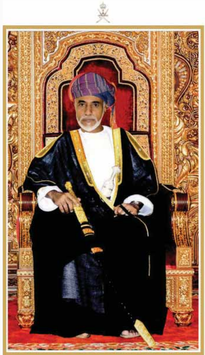
المغفور له السلطان قابوس بن سعيد -طيب الله ثراه-