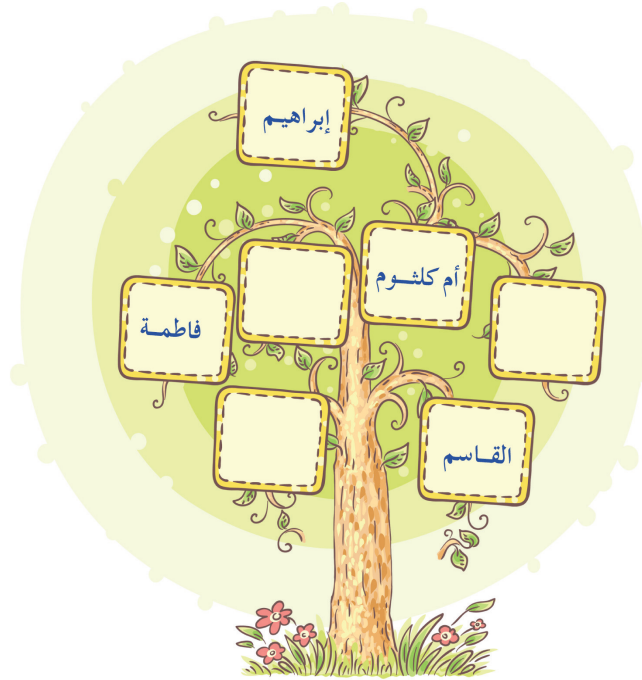
شجرة أبناء الرسول محمد صلى الله عليه وآله