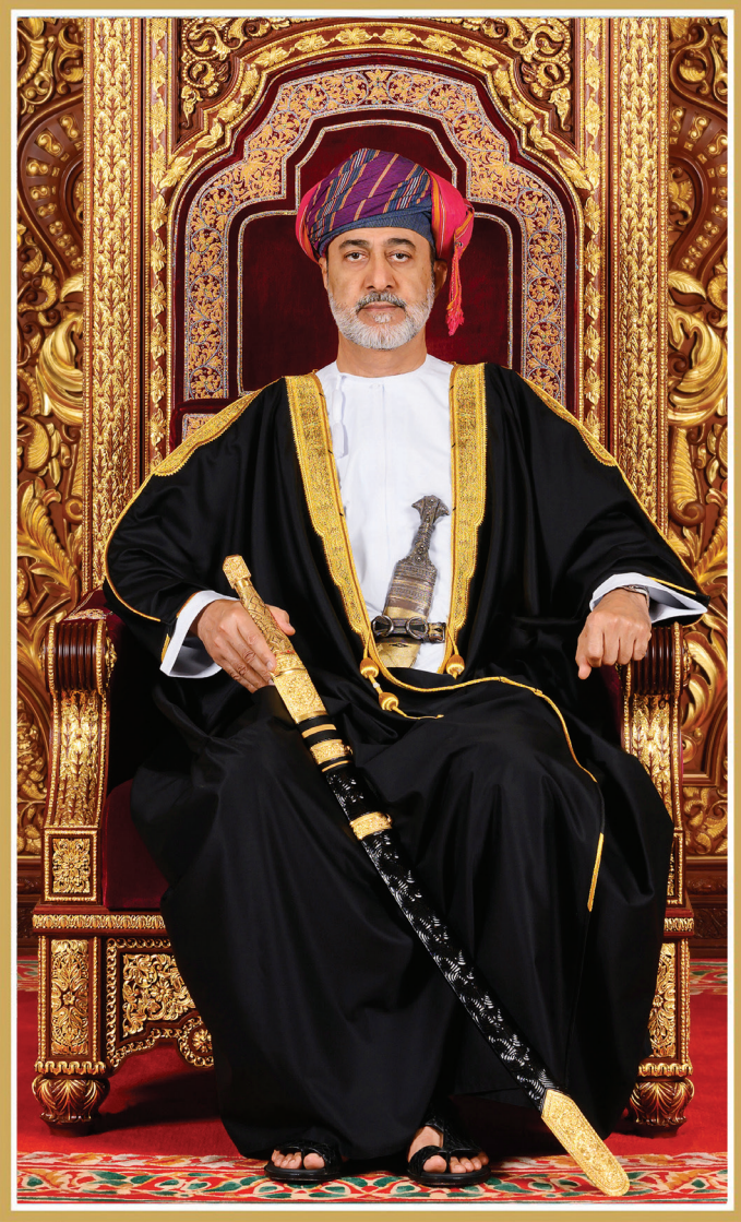
حضرة صاحب الجلالة السلطان هيثم بن طارق المعظم