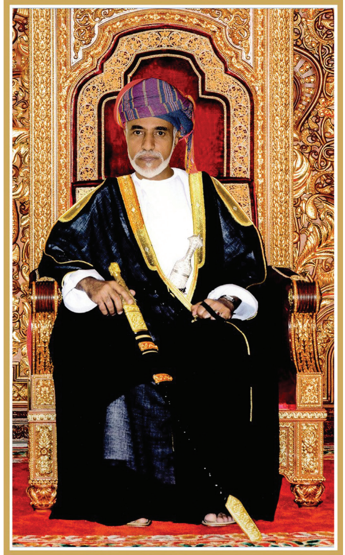
المغفور له السلطان قابوس بن سعيد -طيب الله ثراه-