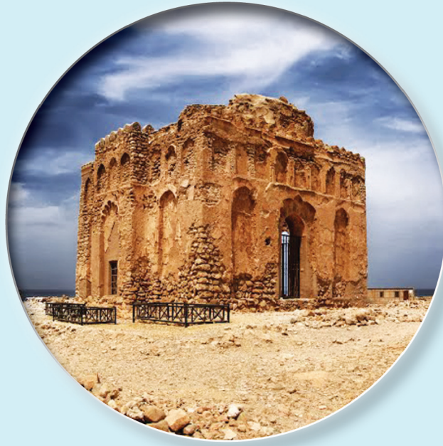
مدينة قلعات الأثرية ضمن قائمة التراث العالمي باليونيسكو ٢٠١٨ م