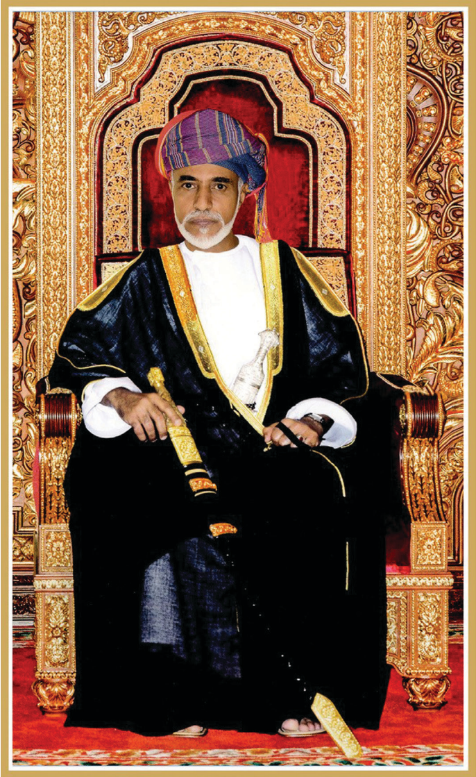
حضرة صاحب الجلالة السلطان هيثم بن طارق المعظم