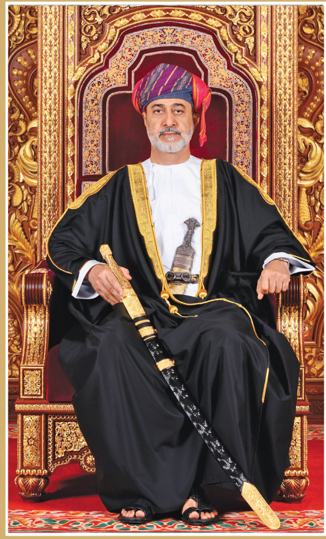
حضرة صاحب الجلالة السلطان هيثم بن طارق المعظم