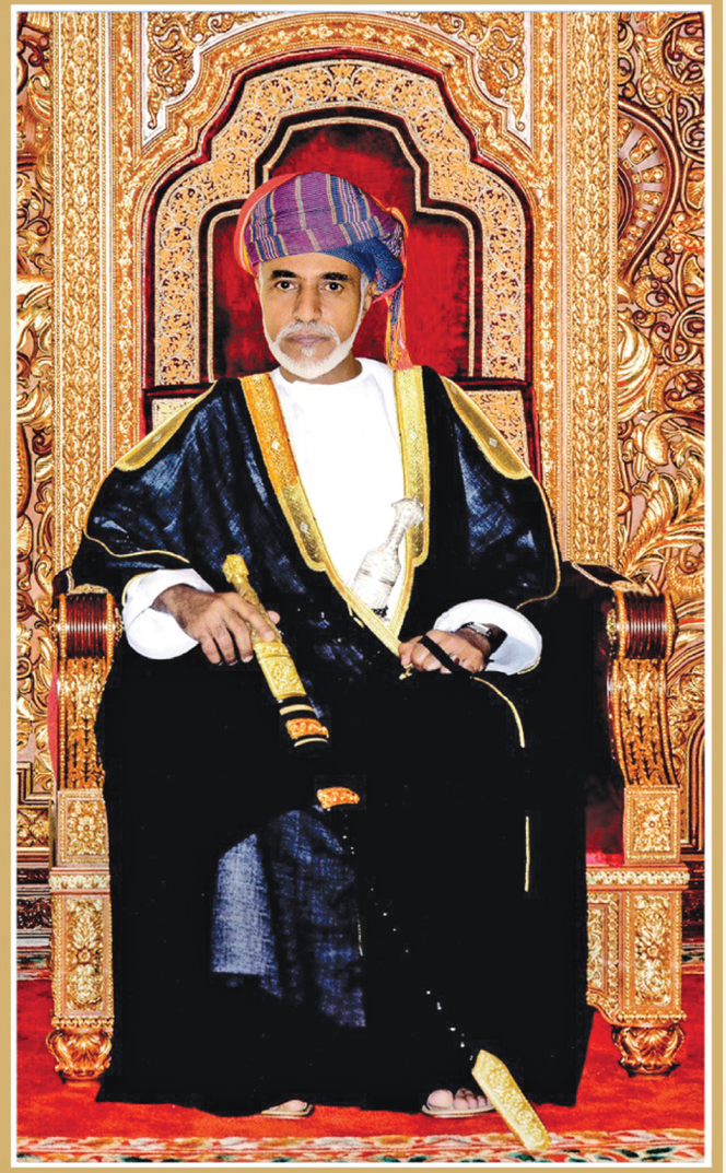
المغفور له السلطان قابوس بن سعيد -طيب الله ثراه-